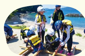
海でのアクティビティ用のいかだを自分たちで製作