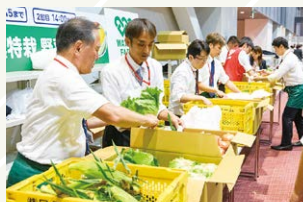
ワタミファームの有機レタスや有機人参などを販売