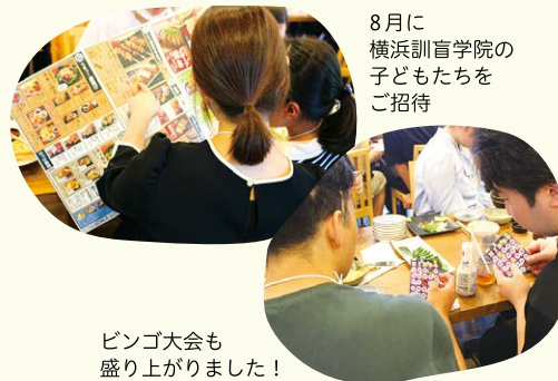
ビンゴ大会も盛り上がりました！

障がいの有無にかかわらず外食を楽しんでいただきたいという思いから、障がい者施設の方々を外食店舗にご招待する「お食事会」。1999年から続けている活動をここ数年は新型コロナウイルス感染症の影響で開催を見合わせていましたが、今年は4年ぶりに開催することができました。