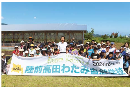
未来の子どもたちのために これからも続けていきたい活動