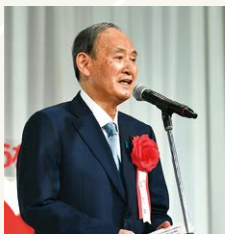
菅義偉様からの祝辞