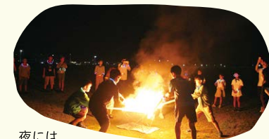
夜にはキャンプファイヤー

8月1日～4日、岩手県陸前高田市にて3泊4日の「陸前高田わたみ自然学校」を開催し、小学4年生～6年生35名が参加しました。自然との触れ合いを通じて命や夢の大切さを学びきっかけづくりを行います。今後も「わたみ自然学校」を通して、未来を担う子どもたちが自然とのふれあいや仲間との交流を通して学べる機会を提供してまいります。