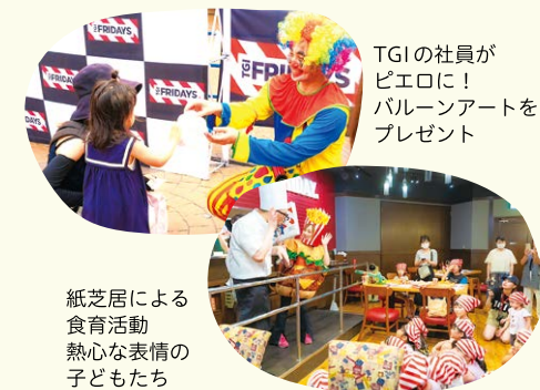
TGIの社員がビエロに！バルーンアートをプレゼント