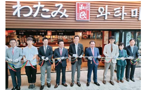
「居酒屋 和民」1号店オープン式典 韓国では現在5店舗を展開

販売といったビジネスモデルを磨き上げ、これを他州にも展開できるように準備を進めています。