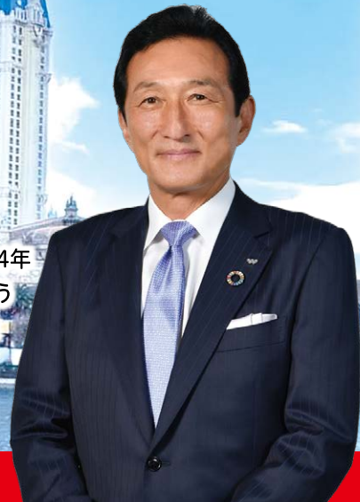
ワタミ株式会社 代表取締役会長 兼 社長 CEO 渡邊 美樹 Miki Watanabe