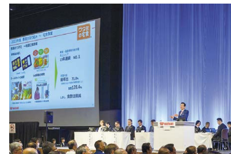
40周年記念で作成された特別VTRとともに、今後の事業計画を発表

今年は5年ぶりにパシフィコ横浜ノースにて「開かれた株主総会」を開催できました。多くの株主様の声を直にお聞きできて、ワタミが考える成長戦略を共有することの大切さを改めて実感いたしました。今後も常にオープンに情報発信を行い、株主の皆様にも経営者としての思いを共有させていただきたいです。