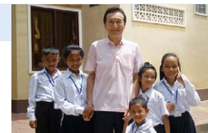
孤児院の子どもたち

孤児院は開園から16年を迎え、定員を80名から100名に拡大し、現在100名の子どもが暮らしております。カンボジアにはまだまだ両親を失った子や虐待にあった子など、多くの子どもが孤児院を必要としています。これからも一人でも多くの子どもが幸せに暮らせるよう、活動を続けてまいります。