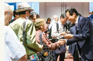
イベント終了後は、株主様一人ひとりをお見送り