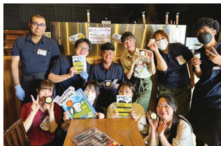
グラスフェッドアイスキャンペーン 販売1週間で2万個以上の大ヒット

さらに、この冬からは、味噌に有機のきく芋を加えた「お通し」を店舗で提供する計画です。きく芋に含まれるイヌリンは血糖値対策に良いとされ、お客様に美味しく食