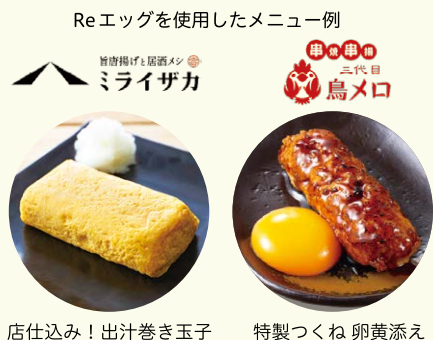
店仕込み！出汁巻き玉子 特製つくね卵黄添え