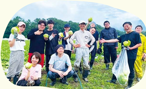
ワタミファーム東御農場で有機レタス収穫体験ツアー