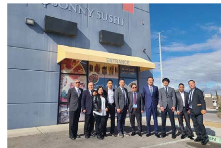
念願のアメリカ本土へ進出! ラスベガスにあるサニー・スシ本社を訪問

〈海外事業〉4月に、米国ネバダ州に拠点を置く「サニー・スシ・カンパニー」とのM&Aを実施しました。ワタミグループがマネジメントする海外企業としては、シンガポールのリーダー・フード社に続いて2社目となります。同社は、ホテルやスーパーマーケット向けに寿司の加工と卸販売をしている会社です。既存の販売チャネルに新たな商品や業態の提案を重ねていくことで、ラスベガスの一流ホテルへのデリバリーや大手スーパーの寿司コーナーでの