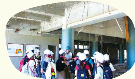
東日本大震災の被災地跡を見学

8月1日～4日、岩手県陸前高田市にて3泊4日の「陸前高田わたみ自然学校」を開催し、小学4年生～6年生35名が参加しました。自然との触れ合いを通じて命や夢の大切さを学びきっかけづくりを行います。今後も「わたみ自然学校」を通して、未来を担う子どもたちが自然とのふれあいや仲間との交流を通して学べる機会を提供してまいります。