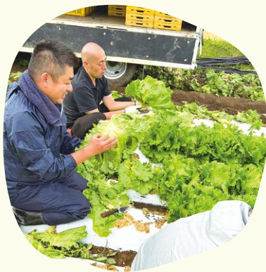
1つつつ丁寧に収穫します

ワタミの外食店舗では、自社農場ワタミファームで育てた有機野菜を使用したサステナブルなメニューを展開しています。5月には長野県東御農場の有機レタスをメニューを販売しました。また「紡ぐツアー」と題し、グループ社員が農場を訪れ、農場長から栽培方法やこだわりについて学び、収穫体験を通して農業や商品への理解を深めています。ワタミでは、商品と共に有機農業への思いやこだわりをお客様に届けるための取り組みを行っています。