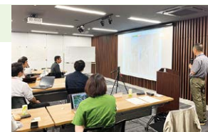
森林アカデミーの様子

ネイチャーポジティブが世界的な目標となり、企業は地球環境や生物多様性を保全し、経済と環境を両立する持続可能な経営が求められる他、TNFD等企業の自然資本に対する情報開示が進んでいます。そこでSEFでは、「なぜ今、企業が森に関わるのか」をテーマに森林再生活動の具体例や生物多様性への取り組み、森林クレジットによる脱炭素社会への貢献を学ぶ機会を提供し、参加企業が自社で「企業の森」活動を通して、森林再生保全・生物多様性保全を実践することを目的に2024年度、森林アカデミーを開催しました。美しい地球を美しいまま子どもたちに残すため、多くの企業が自然資本の増加に関わる環境づくりをし、持続可能な循環型社会の構築に貢献してまいります。