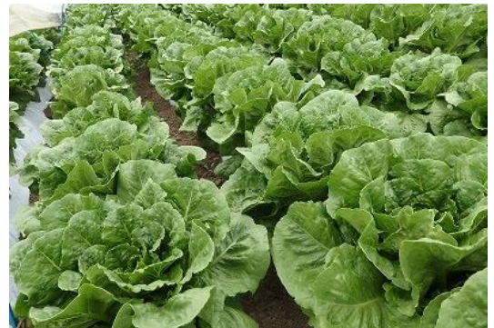
ワタミファーム東御農場の「有機ロメインレタス」