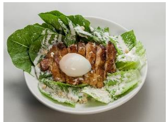
「有機ロメインレタスとケイジャンチキンのごちそうシーザーサラダ」